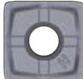
Kova reuna GH lastunmurtaja