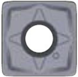
1. suositus (Yleiskäyttöinen) GM lastunmurtaja

Teräpalan laatu ja lastunmurtajan malli erityyppisille koneistusmenetelmille